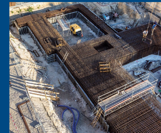
Grundfläche des Turmes vor Guss der Fundamentplatte, Foto: Dr. Peter-Michael Bauers

Der Wiederaufbau der Garnisonkirche erfolgt unter dem Dreiklang Geschichte erinnern, Verantwortung lernen, Versöhnung leben. Der Turm wird ein Lernort der Geschichte, ein Zentrum für Friedens-, Bildungs- und Versöhnungsarbeit.