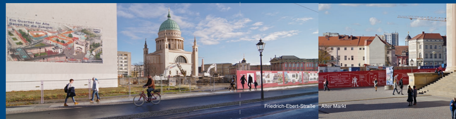
Friedrich-Ebert-Straße Alter Markt