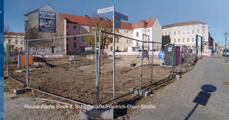
Neubaufäche Block II, Schloßstraße/Friedrich-Ebert-Straße

Für das benachbarte „Haus Einsiedler“, dessen Vorgängerbau „Zum Einsiedler“ ebenfalls im Krieg zerstört wurde, wird der Bauantrag 2019 eingereicht. Mit zeitgenössischer Architektur wird die historische Gestaltung interpretiert. Im Erdgeschoss wird die Sparkasse ihren Sitz haben, darüber entstehen nach derzeitigem Planungsstand 15 Wohnungen.