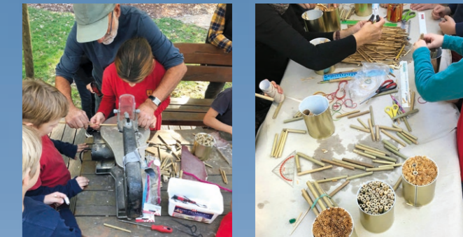
Aktionstage im Fröbelhort - ein Insektenhotel entsteht, Fotos: Birgit Peseko-Lusti, STP

Mit der Fertigstellung des 1. Bauabschnittes können nicht nur die Schüler*innen der Max-Dortu-Grundschule, sondern auch alle Besucher*innen ab Frühjahr 2019 die Plantage als innerstädtische Parkanlage mit Spiel-, Sport- und Bewegungsangeboten nutzen.